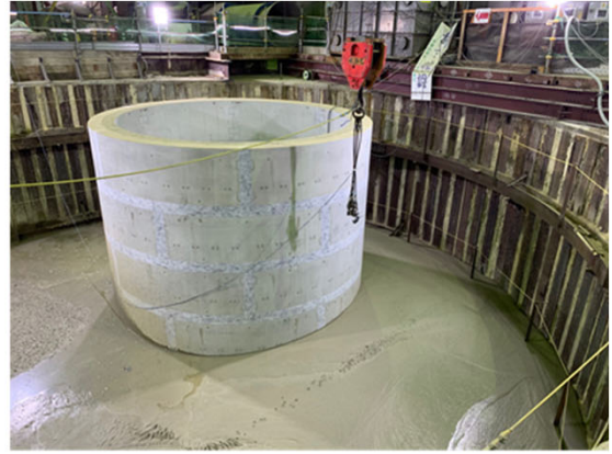
②中間換気所【明治公園】：換気塔の進捗状況 (土木工事)