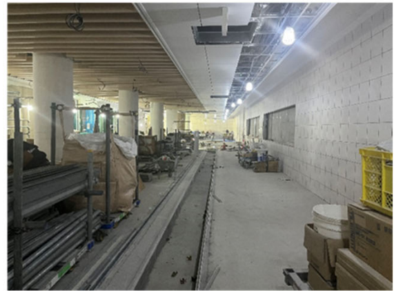
④地下駅舎部：コンコースの進捗状況 （建築・設備工事）