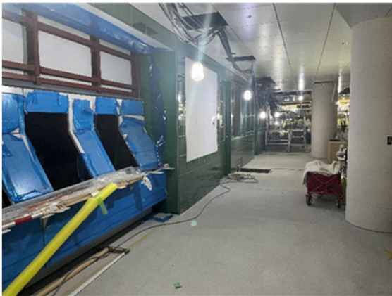
③地下駅舎部：コンコースの進捗状況 （建築・設備工事）