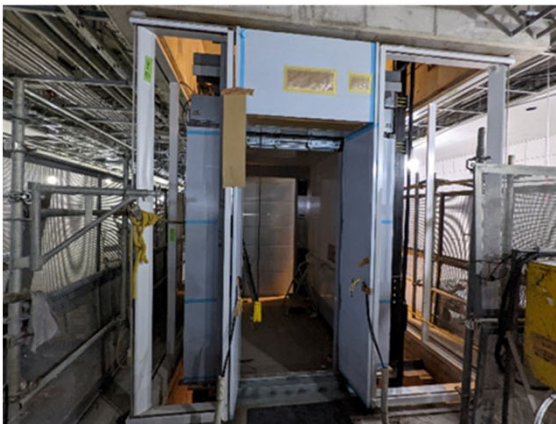
⑤地下駅舎部：コンコースの進捗状況 （昇降機工事）