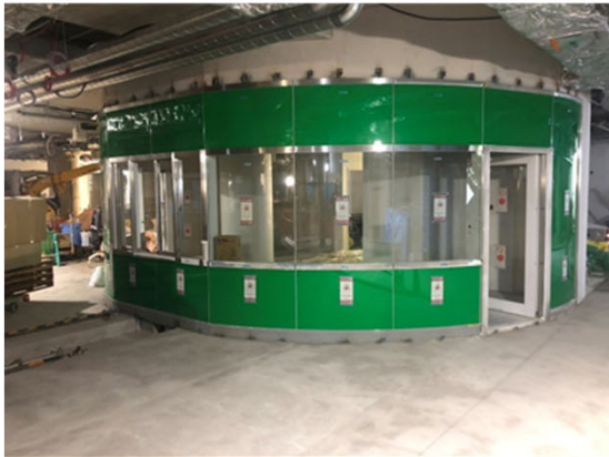
③地下駅舎部：コンコースの進捗状況 (建築・設備工事)