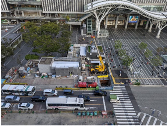
①住吉通りの占用状況 (地上部：工事現場俯瞰)