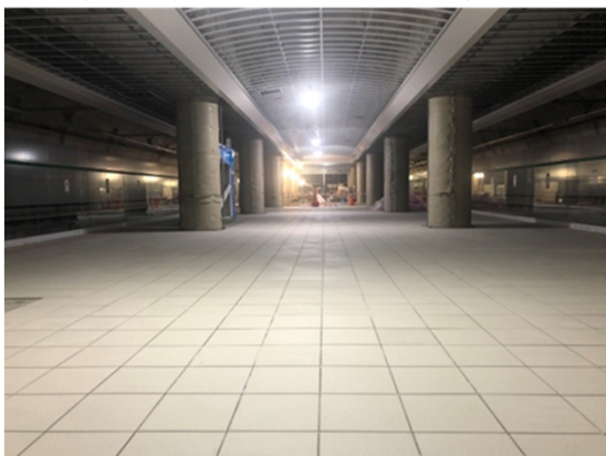
⑤地下駅舎部：プラットホームの進捗状況 (建築・設備工事) ※天井・柱仕上げ工事着手前