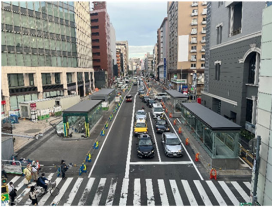
①はかた駅前通りの占用状況 （地上部：祇園町西交差点より）